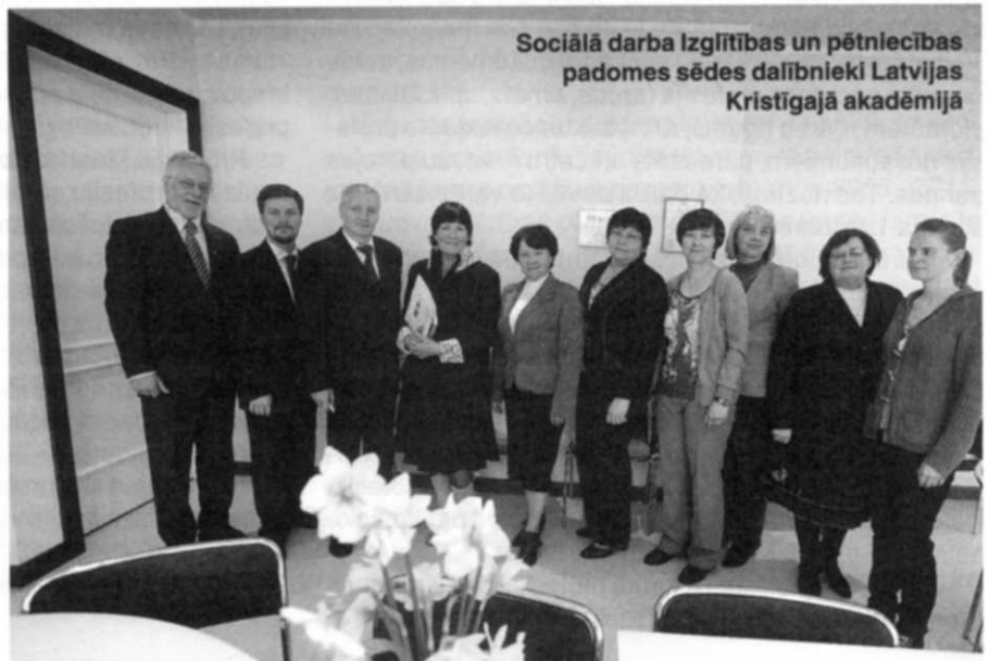
Sociālā darba Izglītības un pētniecības padomes sēdes dalībnieki Latvijas Kristīgajā akadēmijā